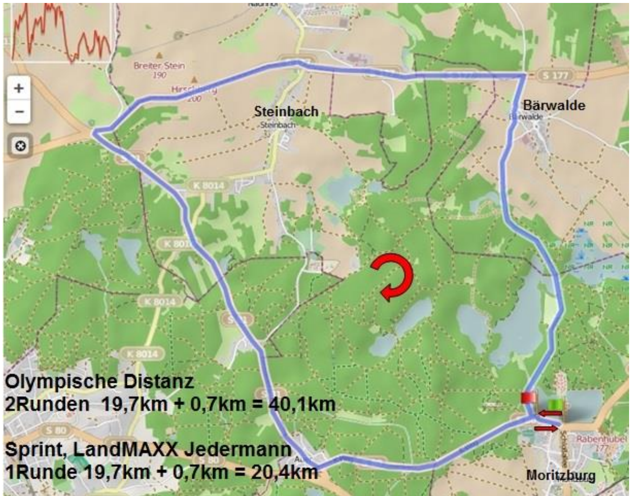
Radstrecke 11.06.2017 Olympische-, Jedermann-Distanz, Sprint