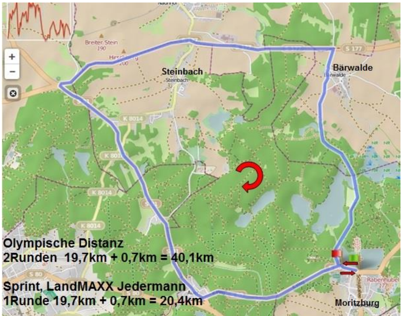
Radstrecke 11.06.2017 Olympische-, Jedermann-Distanz, Sprint